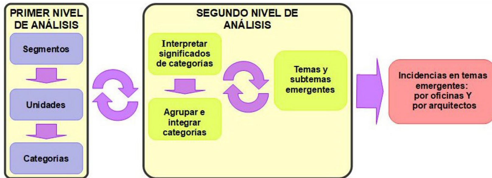
Figura 2. Análisis de la información.

En el primer nivel de análisis (simultáneo a la recolección de información) se identifican segmentos y se seleccionan las unidades, que son analizadas y comparadas para inducir las categorías emergentes, que consiste en analizarlas-relacionarlas-compararlas-y-contrastarlas (Martínez, 2006, p. 76).