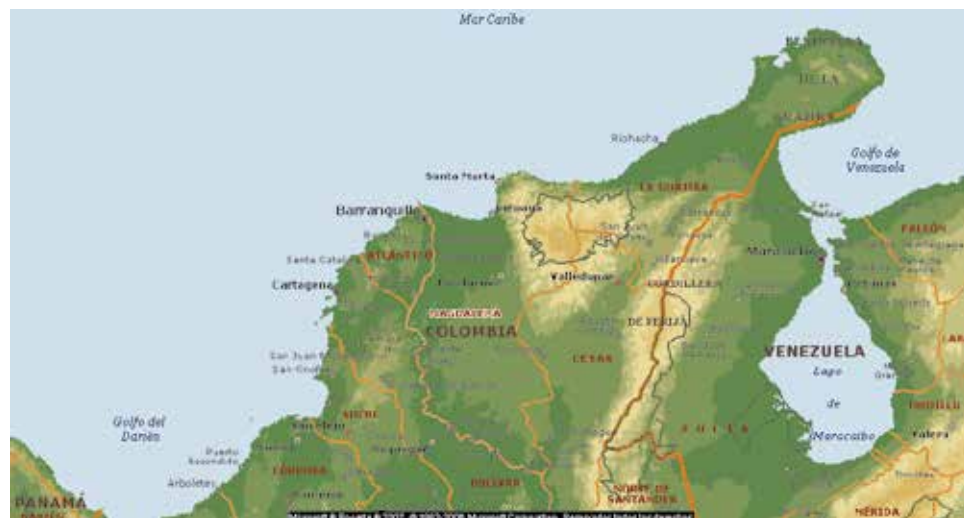
Figura 2. Ubicación de Ciénaga a nivel regional (2007)