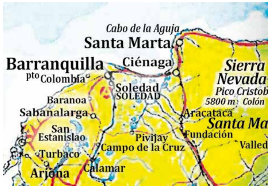
Figura 1. Ubicación de Ciénaga según Santa-Marta y Barranquilla (2004).